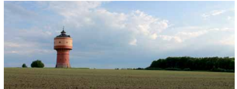
Die neue Umgehungsstraße wird am Wasserturm vorbeiführen

Durch die geplante Südwestumgehung in Mittweida werden einige Grundstückspreise einen erheblichen Wertverlust erleiden. „Vor allem die Grundstücke, in deren unmittelbarer Nähe die Straße gebaut wird verlieren an Wert“, erklärt Peter Großer von der ISG Mittweida.